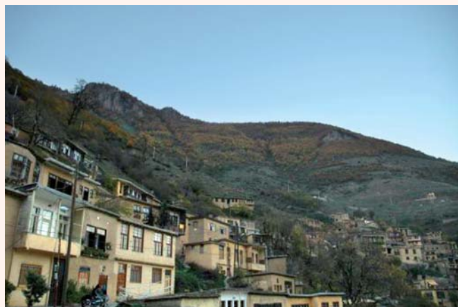
A mountain-surrounded village in the middle of Lebanon

me was different – security issues were more important and public opinion was more apparent. Also I found it hard to adjust to the local climate.