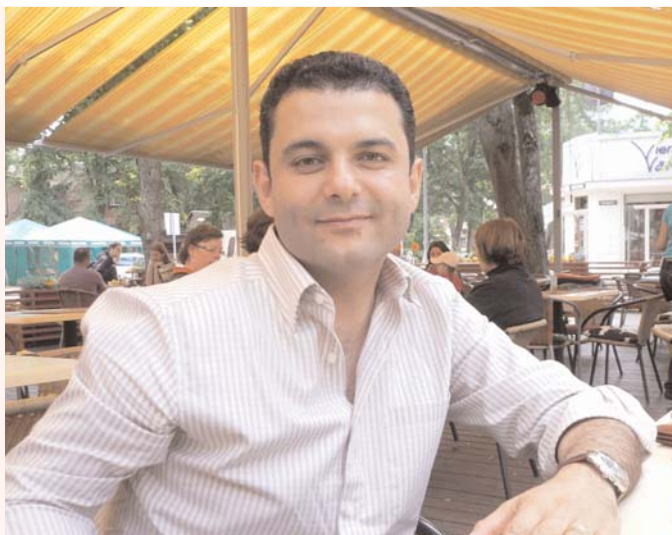
Holiday moments in Latvia