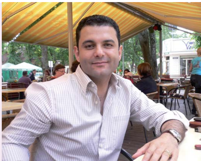
Atpūtas brīdī Latvijā