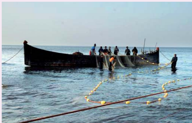
Zvejnieki rīta agrumā velk tīklus Vidusjūrā

Lai arī ārzemniekiem ir plašas iespējas saņemt uzturēšanās atļauju, Latvijā nav imigrācijas valsts. Ārzemnieku īpatsvars Latvijā 2011.gada 1.janvārī bija 2.49% no kopējā iedzīvotāju skaita (ieceļotāji pēc 1992.gada – 1.09%, pārējie ir Latvijas nepilsoņi, kuri, dzīvodami Latvijā, pieņēmuši citas valsts pilsonību). Katru gadu Latvijā pirmreizējās termiņuzturēšanās saņem apmēram 2,5 tūkstošus ārzemnieku. Tas nozīmē, ka visi šie ārzemnieki paliek Latvijā, daudzi pēc darba līguma beigām vai studijām atgriežas savā mītnes zemē. Pirms dažiem gadiem bija liels ārzemnieku pieplūdums sakarā ar nepietiekamo darbaspēku Latvijā, tagad šādu ārzemnieku ir samērā maz. Pašreiz vispopulārākais un visapsprietākais termiņuzturēšanās atļauju pieprasījuma iemesls ir saistībā ar nekustamo īpašumu iegādi Latvijā. No 2010.gada 1.jūlija līdz 2011.gada 20.aprīlim tādās ir pieprasītas 190 ārzemniekiem un 242 viņu ģimenes locekļiem.