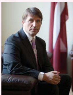
Artis Kampars, Latvijas ekonomikas ministrs

Kā jūs raksturotu Latvijas ekonomikas situāciju? Vai krīze ir pārvarēta un kādas ir prognozes turpmākajai attīstībai?