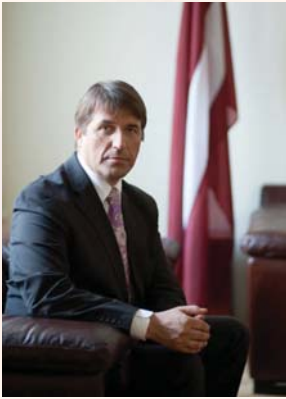
Atis Kampars, Minister of Economy

How would you describe the situation in the Latvian economy? Is the crisis overcome and what are the forecasts for future development?