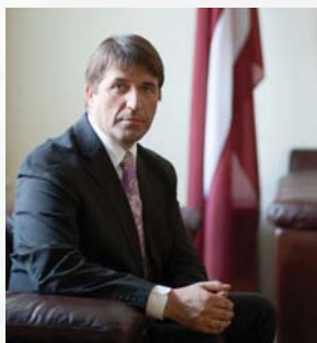
Артис Кампарс, министр экономики Латвии

Как Вы охарактеризовали бы экономическую ситуацию в Латвии? Преодолен ли кризис и каковы прогнозы дальнейшего развития?